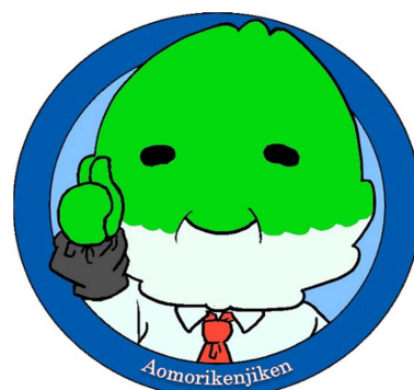
マスコットキャラクター ○ヒバじい○